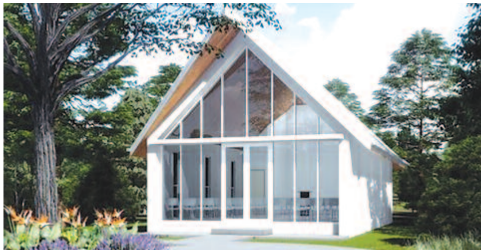
Az épülő templom látványterve

Most itthon tartózkodik, ennek oka, hogy az általa alapított Ausztráliai Magyar Amatőr Szintársulat Kárpát-medencei turnéja veszt, ahol bemutatja Tamási Áron Hullámszó vőlegény című színművét. Marosvásárhelyen, a Maros Művészegyüttes termében szeptember 21-én, Nyáradszeredában 22-én kerül erre sor. A lelkéssel nem az előadásról, hanem az ausztráliai magyarok életéről, a gyülekezetéről, a templomépítéséről beszélgettünk.