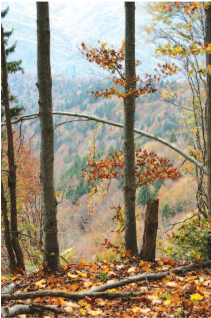
Istenszéke – Nézd csak a tájat, de szépen őszi

101 éve, 1907. szeptember 25-én halt meg Kolozsvárott Kőváry László , a XIX. század egyik leghíresebb művelődéstörténésze, statisztikusa. 1842-ben még joggyakornok a marosvásárhelyi királyi táblán. Az 1848–49-es