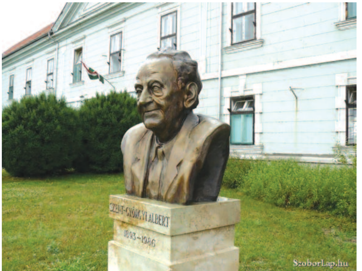
A tudós szobra az enyingi Baththyány-kastély előkertjében

Czeizel Endre Tehetség/talentum / jó szerencse, semmi más? című összegző könyvében bevezeti az életünket meghatározó sorsfaktor fogalmát, és példaként említi a Szent-Györgyi Albert-jelenséget. Első és második világháborús halálközeli történeteit már említettük, de arra is ki kell térnünk, hogy az éppen munkanélkülivé vált Szent-Györgyi Albert 1926 nyarán elhatározta, hogy öngyilkos lesz. Hazaküldte a feleségét a kislányával Magyarországra, ő pedig búcsúképpen Stockholmba utazott az élettani világtalálkozásra. Ott legnagyobb meglepetésére arra figyelte fel, hogy egy cambridge-i professzor előadásában többször említette a nevét, alig érthető kiejtéssel. Az előadás után bemutatkozott a professzornak, és már nem akart meghalni. A fentiekén túl, Szent-Györgyi Albert sorsfaktorának kedvező elemei is vannak: Magyarországra való hazahívása és kutatói elképzeléseinek a támogatása, később pedig éppenséggel a talentumot kevésbé támogató kommunista hazájának a felcserélése a talentumbarát és emberi-tudósi szabadságot nyújtó Amerikával. Mindenkoron megszívulva Szent-Györgyi Albert vallomását: „Az emberiség jövője a neveléstől függ, attól a programozó rendszertől, mely tetszés szerint változtatható... Ebből az következik, hogy a nevelés az emberiség egyik legfontosabb tevékenysége.”